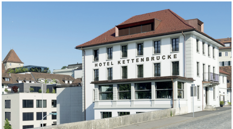
Einst als Zollhaus genutzt, heute ein Stück gelebte Geschichte an der Kettenbrücke (mehr Seite 14).

Seit der Eröffnung des «Zollhuus Aarau» im Juni 2021 dürfen wir uns regelmässig über ein ausgebuchtes Restaurant freuen. Das moderne und trendige Food-Konzept kommt bei Fleisch-Begeisterten genauso gut an wie bei unseren vegetarischen und veganen Gästen. Wir haben das klare Ziel, mit unseren vielseitigen und hochwertigen Kreationen ein Angebot für alle Geschmäcker zu bieten. Dabei besonders wichtig: wir beziehen unser Fleisch ausschliesslich in der Schweiz, alle weiteren Speisen und Zutaten kommen ebenfalls, wenn immer möglich, aus unserem Land. Nachhaltigkeit ist bei